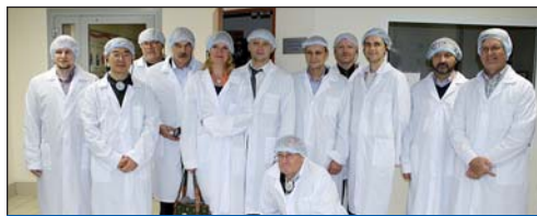
Делегация Российско-американской школы на производстве «Дана-флекс»